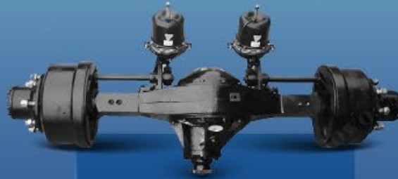
Hệ thống cầu công nghệ & tiêu chuẩn MAN mới