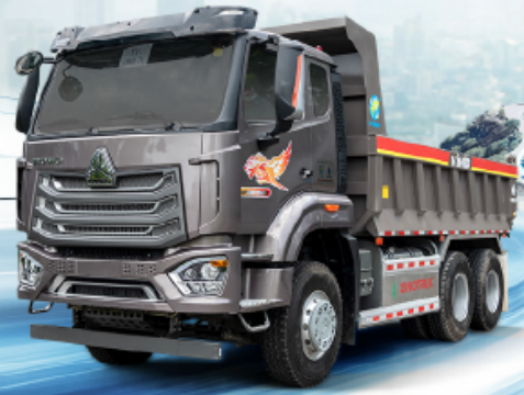
XE TẢI TỰ ĐỔ NX 350 6X4 THÙNG ĐÚC