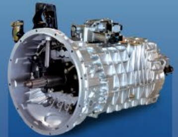
HỘP SỐ SINOTRUK