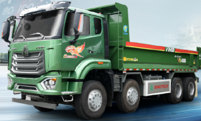
XE TẢI TỰ ĐỔ NX 350 8X4 THÙNG ĐÚC