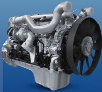
Động cơ công nghệ & tiêu chuẩn MAN MC07H